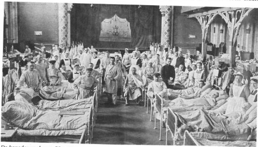
De benedendaal voor 83 patiënten. Foto uit het verslag van Van der Goot (zie noot 18); de fotograaf is onbekend.

Vanaf de mobilisatie van het Nederlandse leger in augustus 1914 waren twee diaconessen ter beschikking gesteld aan het militair hospitaal in Arnhem dat in het diaconessenhuis was gevestigd. Aanvankelijk werd hiervoor geen vergoeding betaald. Na een paar maanden wilde de diaconie van de hervormde gemeente de diaconessen elders