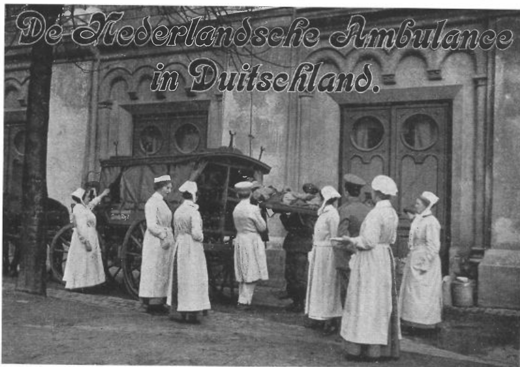
Een gewonde militair wordt uitgeladen vóór de ingang van het Nederlandse hospitaal. Om brandstof te besparen wordt paard en wagen gebruikt.

In de periode tot 27 juli 1916, toen de groep werd afgelost, werden 775 gewonde Duitse (en soms Russische) militairen opgenomen, waarvan er elf overleden. Dagelijks werd er geopereerd. Het kleine werk betrof het verwijderen van losse beensplinters, kogelextracties en tandheelkundige ingrepen. Grotere operaties vonden ook plaats, waarbij dan gedacht moet worden aan zenuwhechtingen, plastische chirurgie aan kaken, het doorsnijden van botten om verkromming tegen te gaan, behandeling van abcessen en in een enkel geval het uitvoeren van een amputatie.