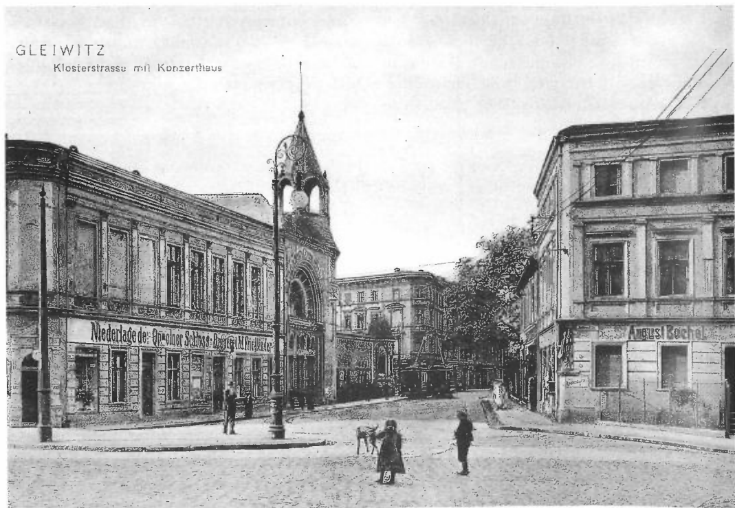
Ansichtkaart van het Theater- en Konzerthaus in Gleiwitz, 1907. ( https://archiwum.allegro.pl , geraadpleegd 28 augustus 2021).

Alle maaltijden werden evenwel gezamenlijk genomen in de eetzaal van het Konzerthaus, alwaar Mejuffrouw Strobel zorgde voor de Hollandsche tafel in een onder haar beheer staande keuken, waarin eveneens gekookt werd voor eenige zware patiënten, die een speciaal dieet hadden te volgen. 22