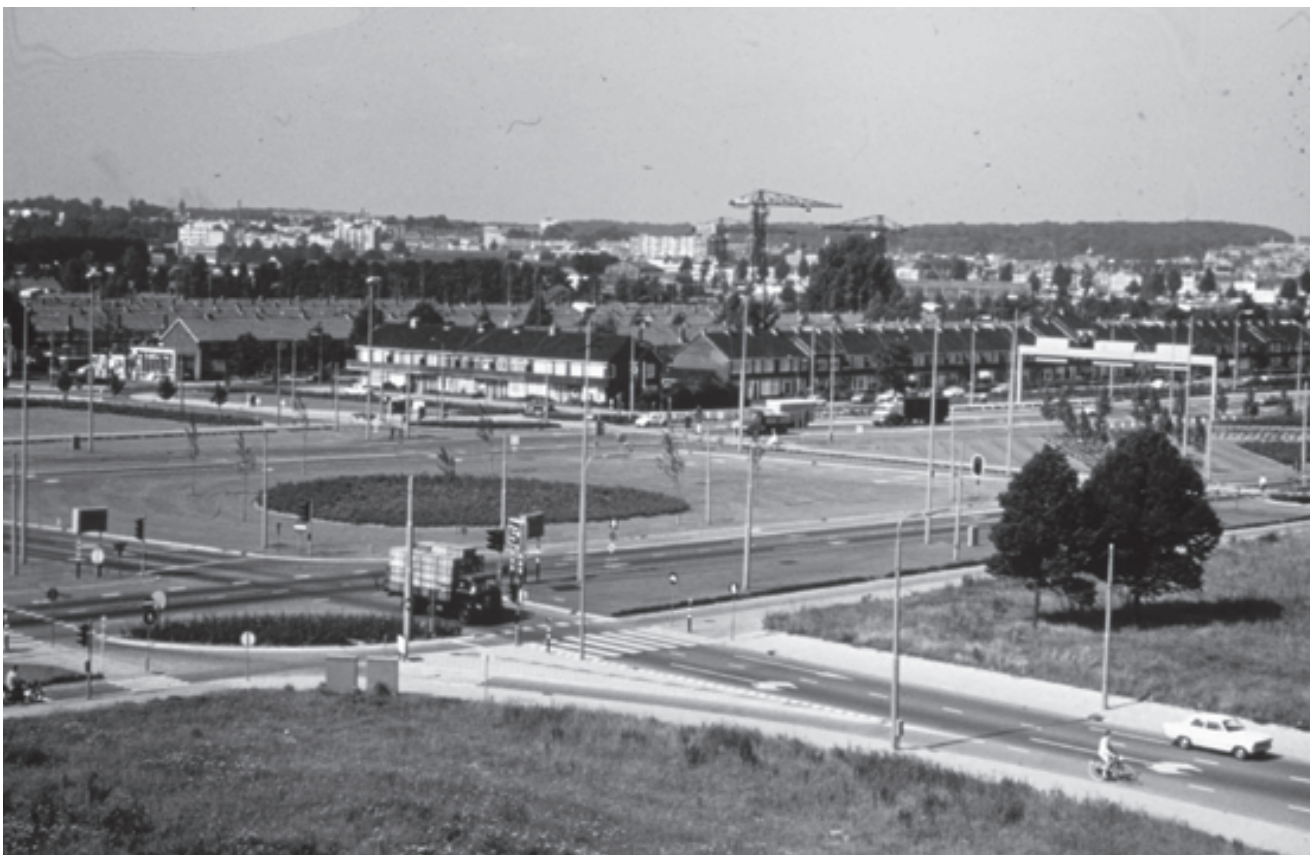
Foto van de nieuwe verkeerssituatie op het De Monchyplein in de tweede helft van de jaren zestig. Het monument is verdwenen en de Gelderse Rooslaan 'loopt' er nu dwars overheen.

Medio jaren zestig werd vrij plotseling en snel besloten dat het De Monchy-monument moest verdwijnen, omdat het verkeersplein in Arnhem-Zuid volledig op de schop ging. De nieuwe indeling van het plein werd in verschillende fasen uitgevoerd en hield onder andere in dat er nieuwe asfaltbanen werden aangelegd. Op maandag 2 augustus 1965 begon Heijtings Aannemingsbedrijf N.V. uit